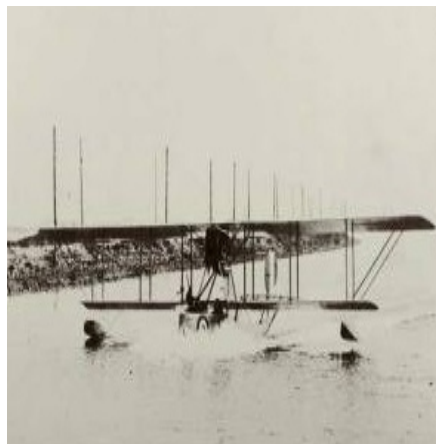
Idrovolante alla base di isola Gorgo

Nel frattempo vennero costruiti asili, scuole, strade, ponti, un ricreatorio, una biblioteca, scavati canali, bonificate aree paludose, riconosciuta l'Azienda Bagni e la vita prosperò anche grazie alle varie istituzioni preposte; vennero creati due ospedali, uno militare nello Zipser ed uno civile nella pensione Villa Santina, mentre il pronto soccorso nel Municipio (situato dove oggi c'è la Guardia Costiera). Nei primi mesi dell'anno il comando passò al Capitano di Vascello Alfredo Dentice di Frasso (a cui è dedicato un canale, quello conosciuto anche come Canale della Schiusa). Il 18 marzo 1916 venne bombardata Punta Sdobba dove vi era situata una postazione di cannoni. Il 23 giugno l'aviere Ernesto Gramaticopulo, stanziato a Grado, venne abbattuto su Capodistria (gli sarà dedicata una via vicino alla Diga).