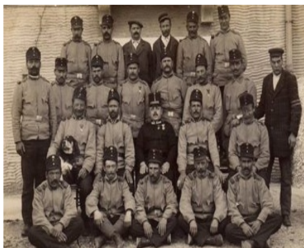
Alcuni cittadini gradesi durante la guerra

Poi arrivarono a difendere l'isola 300 soldati della Regia Brigata Marina (a cui è dedicata una via), Marinai comandati dal tenente di vascello Luigi Rizzo (a cui è intitolata l'Associazione Marinai d'Italia di Grado ed una via) e dal capitano di corvetta Filippo Camperio (a cui è dedicata una riva del porto). Con il tempo si instaurarono circa 3000 militari (tra italiani, inglesi, francesi e scozzesi) muniti di due monitori, due pontoni armati, due cannoniere, tre vedette, una squadriglia di torpediniere (a cui è dedicato un molo del porto), due squadriglie di idrovolanti (stazionate a isola Gorgo, nella fabbrica del ghiaccio, nel retrospiaggia e vicino al porto), una squadriglia di Mas (motoscafi anti sommergibile) e varie batterie di cannoni da 76-152-190mm (a Portobuso, isola Morgo, S.Pietro d'Orio, Ravaierina, a Belvedere, Punta Spin, Golametto, Rotta, Punta Sdobba e nella Spiaggia Principale). Il comando fu posto all'Albergo Fonzari e punti di avvistamento e segnalazione sul tetto del Fonzari e della Villa Grado. Per evitare facili punti di riferimento a favore del nemico venne abbattuto il campanile dell'isola di S.Pietro d'Orio.