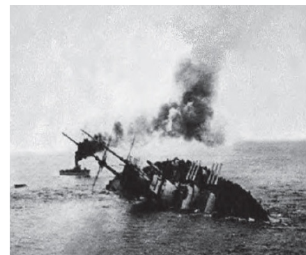
Affondamento della corazzata "S. Stefano"

ritornò austriaca. Venne a visitarla anche l'Imperatore d'Asburgo Carlo e la moglie Zita, i paesani li accolsero a braccia aperte. Nel mentre, da Venezia i marinai italiani formarono due Battaglioni: il Grado ed il Monfalcone, poi il 9 dicembre 1917 arrivò l'ordine a Luigi Rizzo di mettere in opera il piano studiato a Grado per andare con i Mas a Trieste ad affondare la corazzata austriaca "Wien", l'ordine fu portato a compimento con successo grazie a due siluri lanciati simultaneamente; questo affondamento rappresentò una delle maggiori operazioni italiane della prima guerra mondiale. Durante la guerra affonderà anche un'altra corazzata austriaca, la "Santo Stefano" il 10 giugno 1918 a Premuda in Croazia. L'Italia intera lo chiamerà "l'affondatore" e lo premierà con medaglie e promozioni.