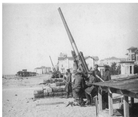
Batteria di cannoni posizionata in spiaggia

Il 5 giugno 1915 ci fu un bombardamento aereo e navale e la gente avisata dal suono delle campane si riparò dentro la Diga ed in specie di trincee private. Poi arrivarono a dare una mano i Fanti del 203° battaglione. Varie volte l'isola venne bombardata dagli austriaci, vi perirono militari, paesani e bambini. Il 16 giugno il Re d'Italia Vittorio Emanuele III visitò Grado e Barbana, il 18 agosto il generale Luigi Cadorna fece un sopralluogo alla difesa dell'isola, il 25 agosto giunse il tenente del Novara Cavalleria, Gabriele D'Annunzio in qualità di osservatore, infine arrivò anche il Presidente del Consiglio Antonio Salandra. Il 28 agosto una squadriglia di aerei francesi alleati si stanziò sull'isola, mentre numerose furono le incursioni notturne nel porto di Trieste per capire come affondare le navi militari austriache, da parte di Luigi Rizzo ed i suoi Mas. Il 30 settembre 1915 il Capitano di Corvetta Carlo Rossetti sostituì Camperio, poi alcuni pescatori gradesi si arruolarono volontari con le forze militari italiane, tra cui Francesco Facchinetti e Biagio Marin.